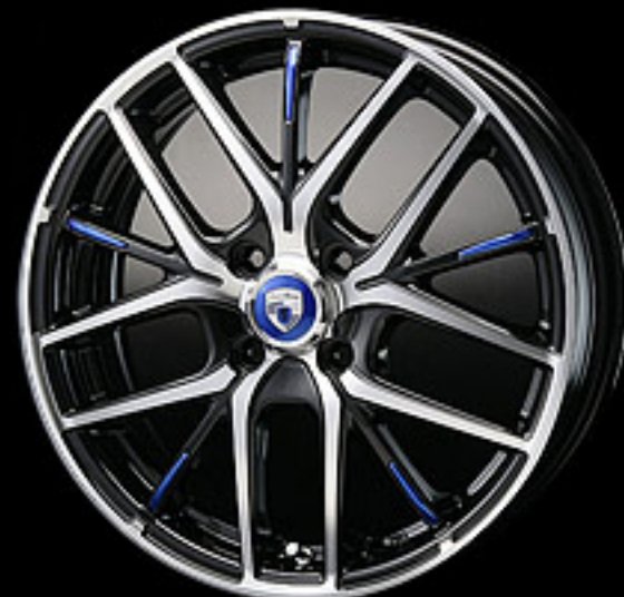
16×5.0J-4H 銘板Capブルー アクセントプレートブルー