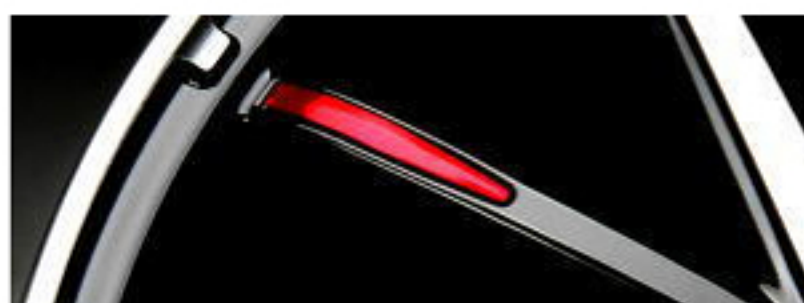
アクセントプレート レッド