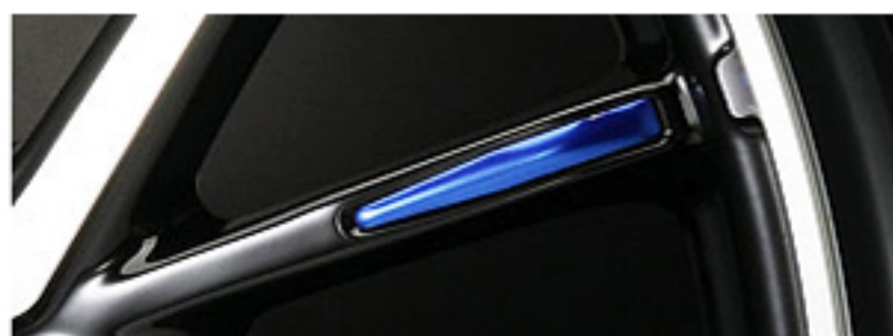
アクセントプレート ブルー